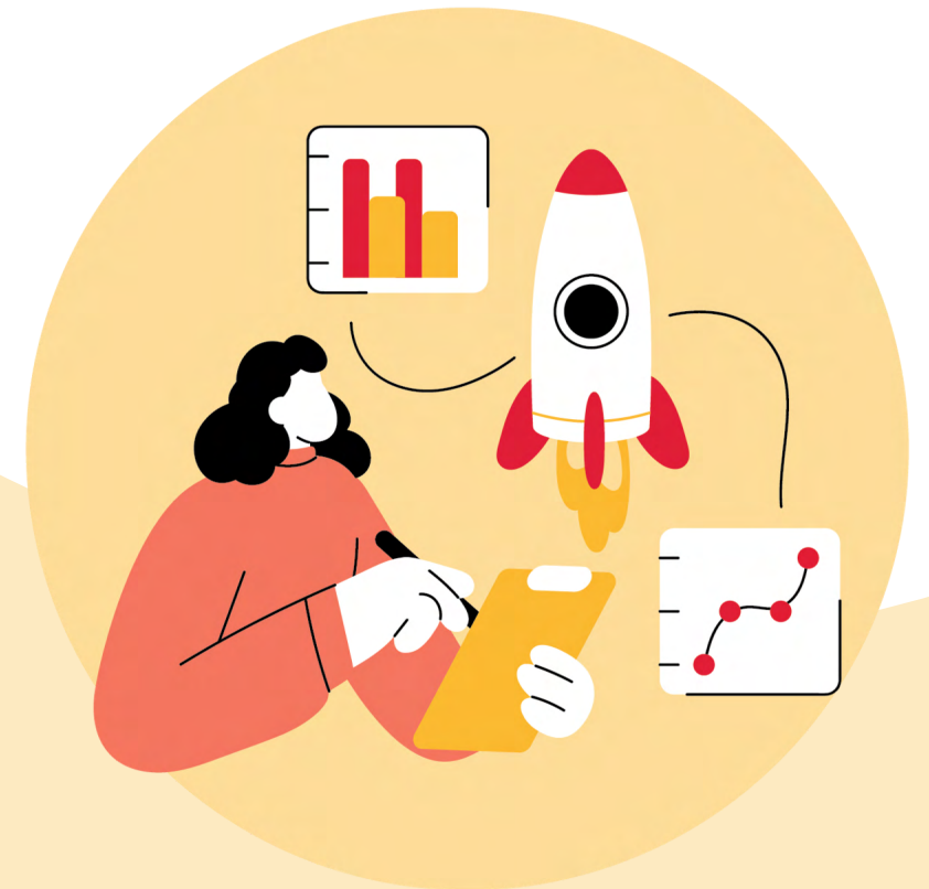
3. Versnellen van verandering