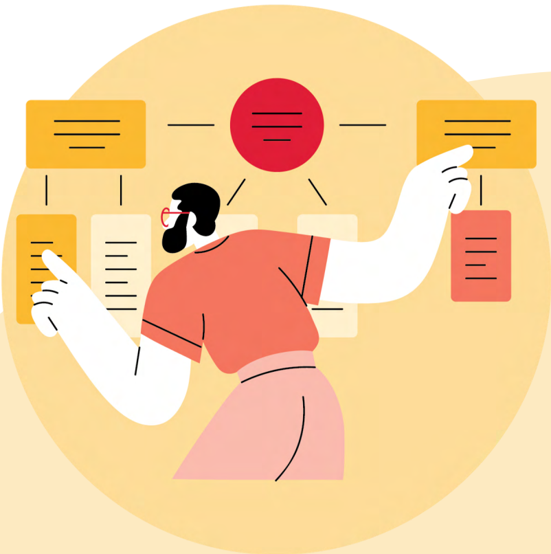
1. Zorgprocessen van de toekomst