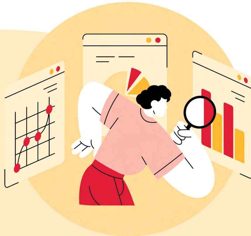
2. Digitale strategie